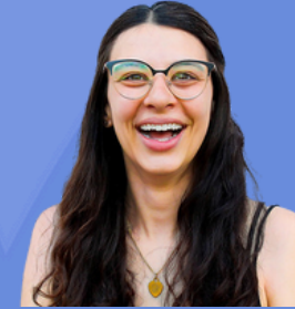
Mafe Barrientos communications, rédaction